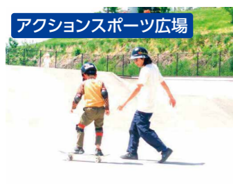
アクションスポーツ広場